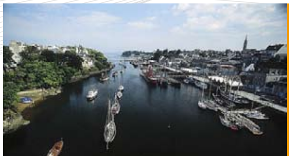
Baie de Douarnenez